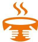
Ondervoeding lokale bevolking